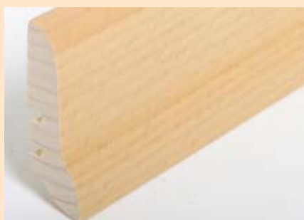
Holzart Buche (passend zu Buche lebh. + harm.)

Art. Nr. 2072-000003, Abm. 22/40 mm Art. Nr. 2072-000007, Abm. 22/60 mm