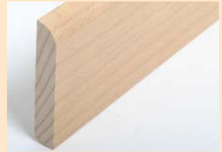
Holzart Buche (passend zu Buche lebh. + harm.)