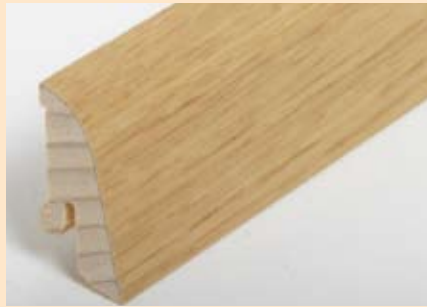
Holzart Eiche (passend zu Eiche lebh. + harm.)

Art. Nr. 2072-000004, Abm. 20/40 mm Art. Nr. 2072-000008, Abm. 20/60 mm