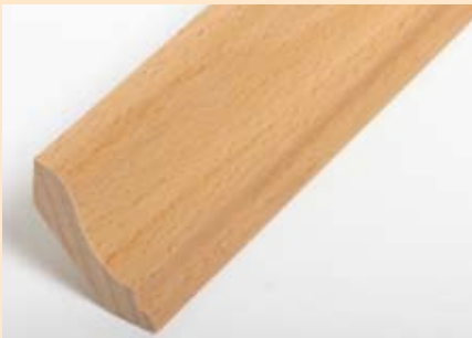
Holzart Buche mit Kanisprofil (passend zu Buche lebh. + harm.)