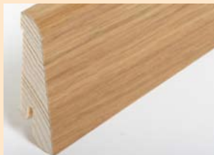
Holzart Eiche (passend zu Eiche lebh. + harm.)