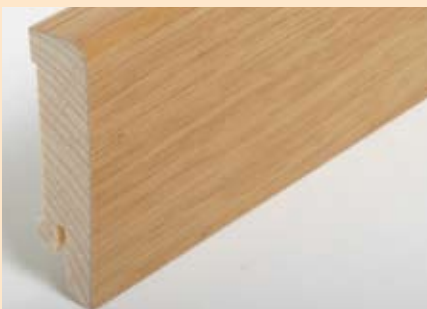
Holzart Eiche (passend zu Eiche lebh. + harm.)