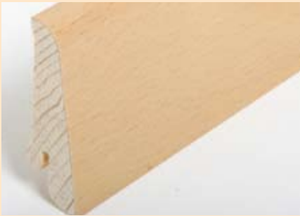
Holzart Buche (passend zu Buche lebh. + harm.)