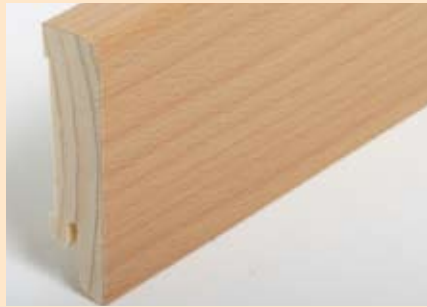
Holzart Buche (passend zu Buche lebh. + harm.)