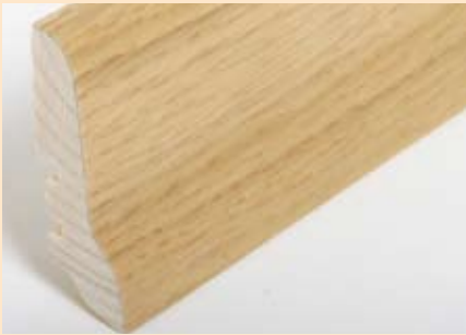
Holzart Eiche (passend zu Eiche lebh. + harm.)

Art. Nr. 2072-000004, Abm. 20/40 mm Art. Nr. 2072-000008, Abm. 20/60 mm