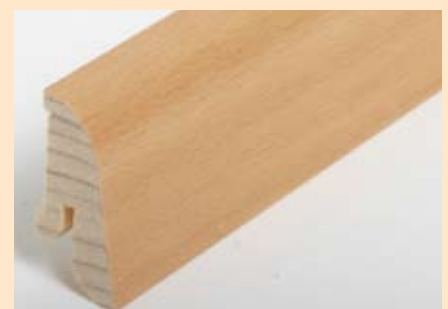
Holzart Buche (passend zu Buche lebh. + harm.)

Art. Nr. 2072-000003, Abm. 22/40 mm Art. Nr. 2072-000007, Abm. 22/60 mm