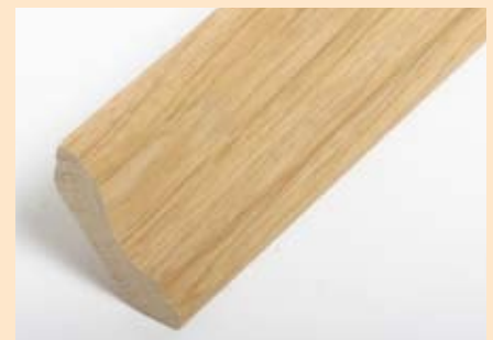
Holzart Eiche mit Kanisprofil (passend zu Eiche lebh. + harm.)