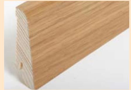
Holzart Eiche (passend zu Eiche lebh. + harm.)