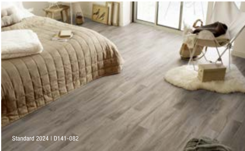
Standard 2024 | D141-082