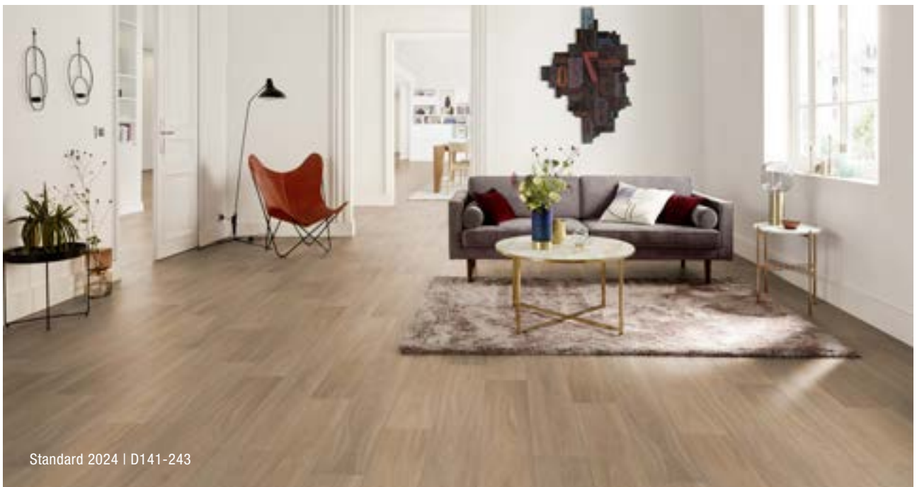
Standard 2024 | D141-243